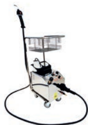
Sanificazione ecologica a vapore

N el dettaglio i nostri prodotti: NaturalOzone Plus 120: Per eseguire una pulizia biologica di camere di hotel o piccoli ambienti.