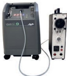
Sanificazione controllata a 360°